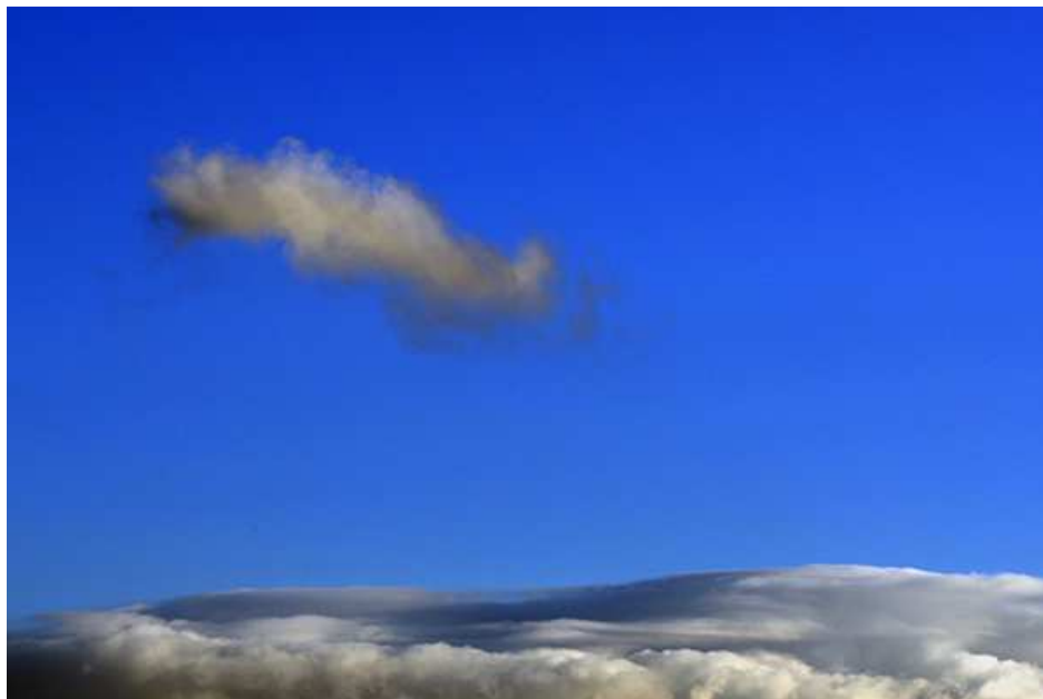
Esempio di fotografia minimalista.

Un paesaggio con pochi elementi, e il suo riflesso, possono regalarvi un'ottima fotografia minimalista. Spesso basta anche una nuvola nel cielo per ottenere una bella immagine.